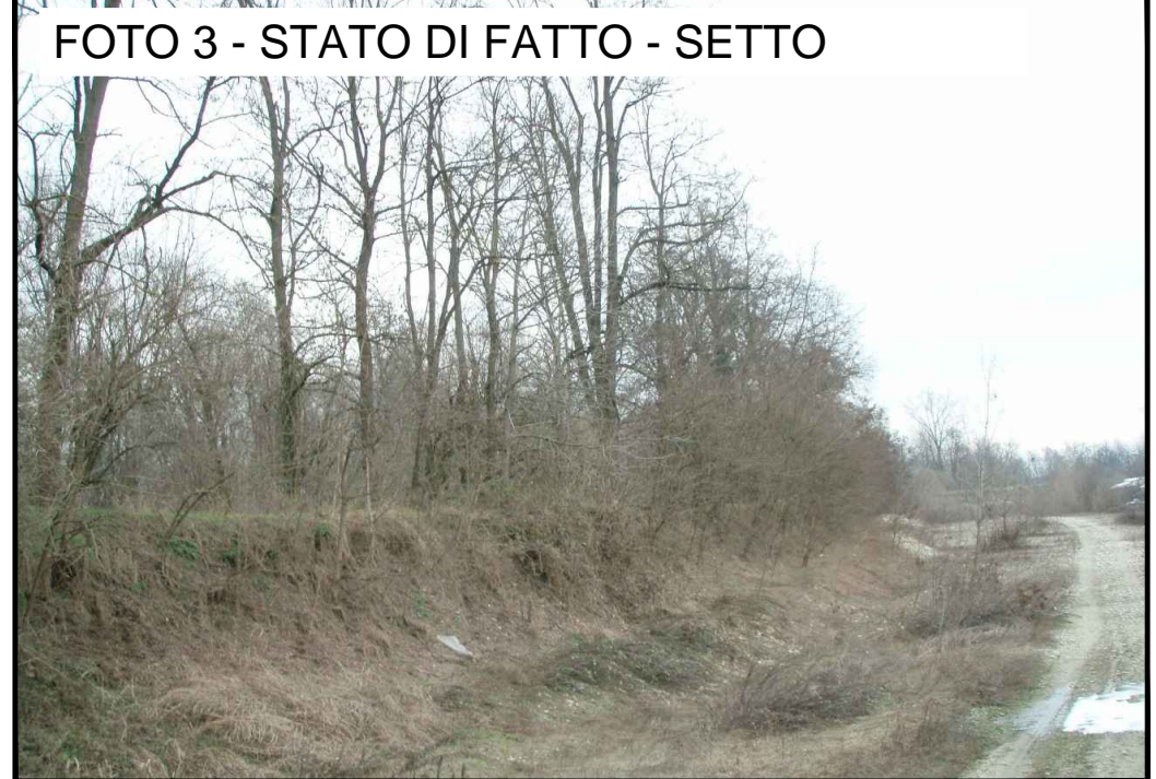
CAVA 1: 1) Gradonatura sponda - Il materiale scavato a prevalente matrice ghiaiosa sarà destinato al risarcimento stradelli in ghiaia utilizzati in ambito di cantiere e alla realizzazione delle piste di servizio arginali 2) Dopo l'escavazione, l'area verrà recuperata a livello ambientale con l'introduzione di vegetazione ripariale arbustiva e planiziale, laminato e cannetta, utilizzando le specie elencate in Tabella e quantificate nel relativo C.M.E.